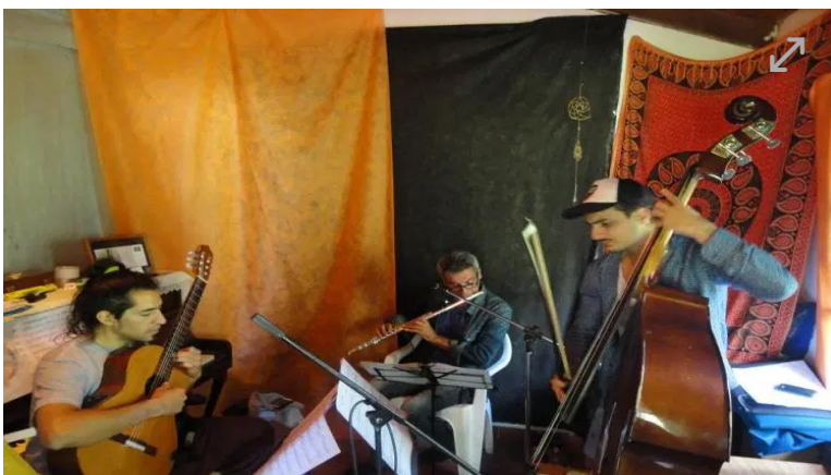
Xunorus dará dos show en la sala Amankay con clásico de ayer, hoy y siempre.